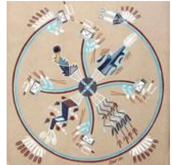
Big Whirling Yei, Navaho sandpainting

Zoals de bevers dammen maken en de vogels nesten, zo maakt de mens religieuze en filosofische systemen. Of, zoals Jung heeft gezegd: de ziel is van nature religieus.